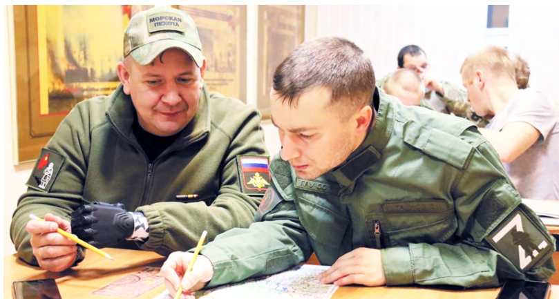
▲ Тактика, топография и «Зарница 2.0». Прошел двухдневный семинар для руководителей военно-патриотических клубов региона