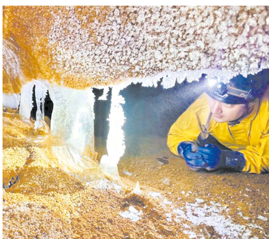
▲ Спелеологи увеличили длину уникальной пещеры «Черный Кот» в Режевском природно-минералогическом заказнике