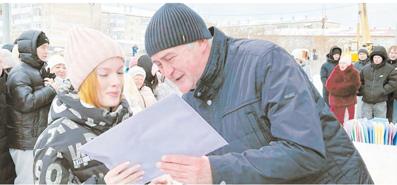
Некоторые сироты ждали собственного жилья по несколько лет. С новосельем!