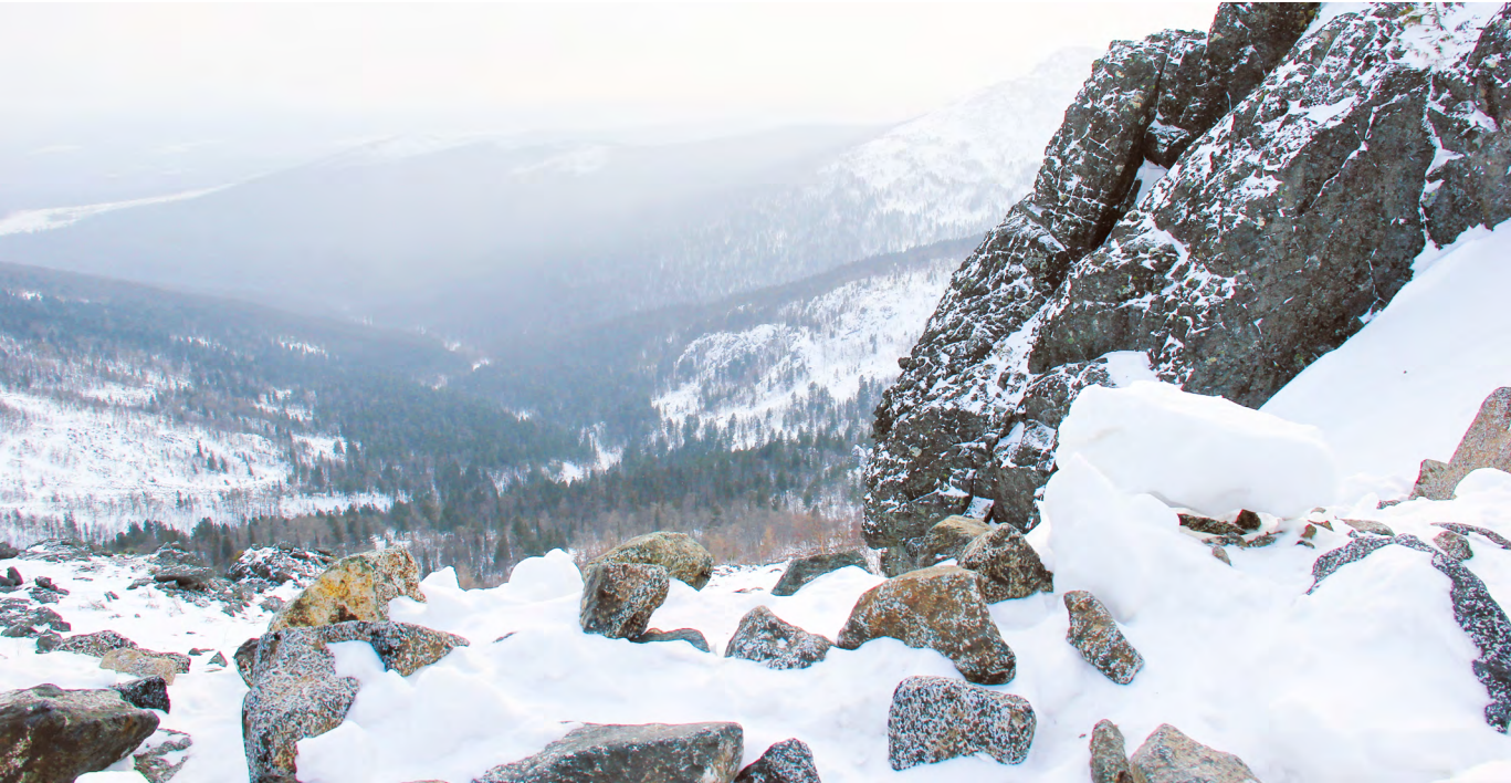
Горы Северного Урала и без того популярны и привлекательны, а теперь здесь стоит ждать гораздо больше туристов со всей России! Численность гостей наверняка увеличится и в городах, расположенных по пути