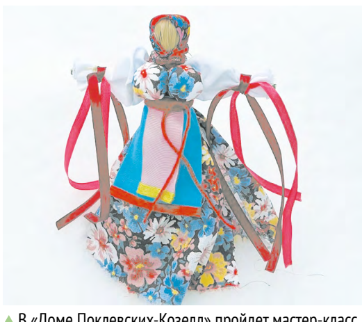
▲ В «Доме Поклевских-Козелл» пройдет мастер-класс по созданию обрядовой куклы на Масленицу