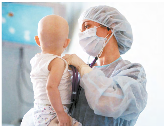
▲ Современные методики и опыт врачей обеспечили 86% долгосрочной ремиссии у детей с онкопатологиями