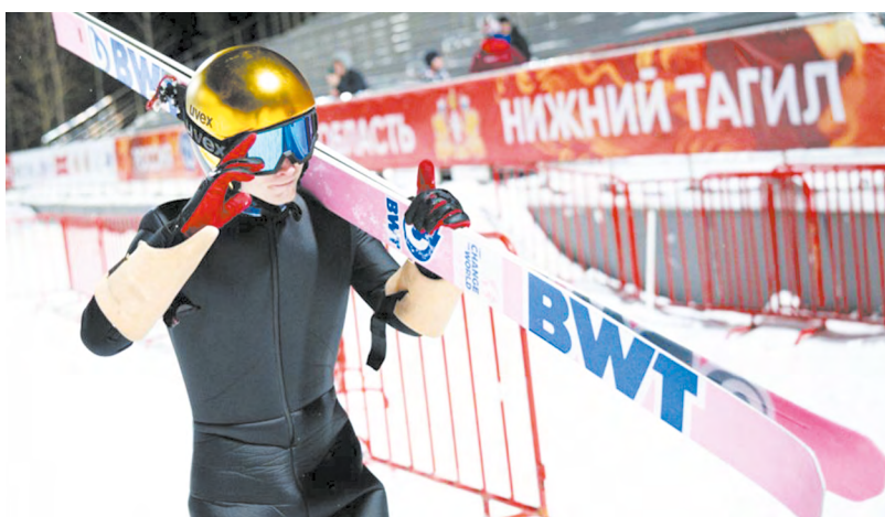
▲ Свердловские летающие лыжники собрали полный комплект наград на чемпионате России по прыжкам на лыжах с трамплина