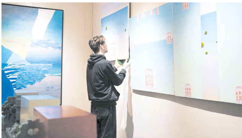
▲ В Главном здании готовят двойную выставку авангарда из музейной и частной коллекции