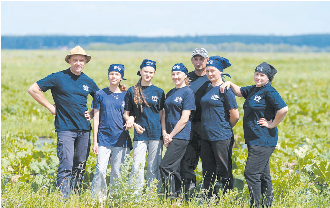
Команда бренда NOMAD собора выезжает на заготовки сырья – в данном случае, коллектив на сборе ревеня!