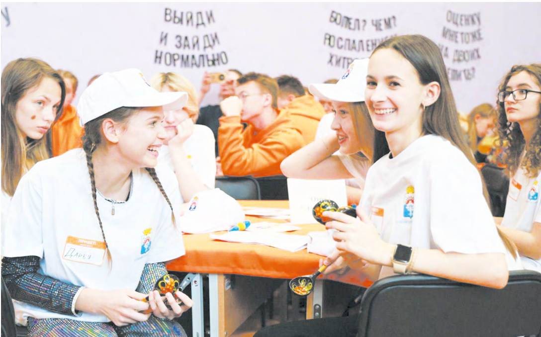
Еще больше уральских детей и молодежи смогут отдохнуть этим летом в загородных лагерях и санаториях!