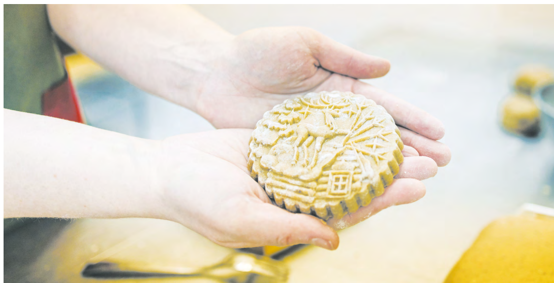
Уральский пряник признан одним из гастрономических символов Свердловской области

В результате кропотливого труда был создан не просто премиальный продукт – целая его линейка. NOMAD стал первооткрывателем, а его наработки в 2024 году легли в основу межгосударственного ГОСТа. Сегодня при бренде существует школа, передающая уникальные знания новым производителям.