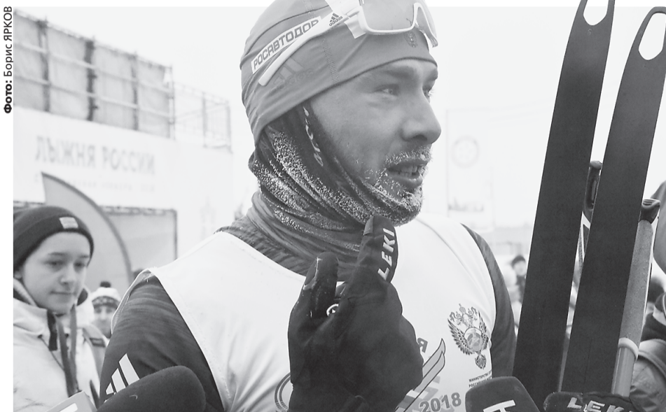
Антон Шипулин отметил: «Я рад был услышать перед стартом гимн Российской Федерации. Настроение отличное!»

Во-вторых, многочисленные участники и зрители увидели победный финиш биатлониста, олимпийского чемпиона Антона Шипулина, который стал первым в 10-километровой гонке среди спортсменов-профессионалов. Он преодолел дистанцию за 22 минуты 44 секунды.