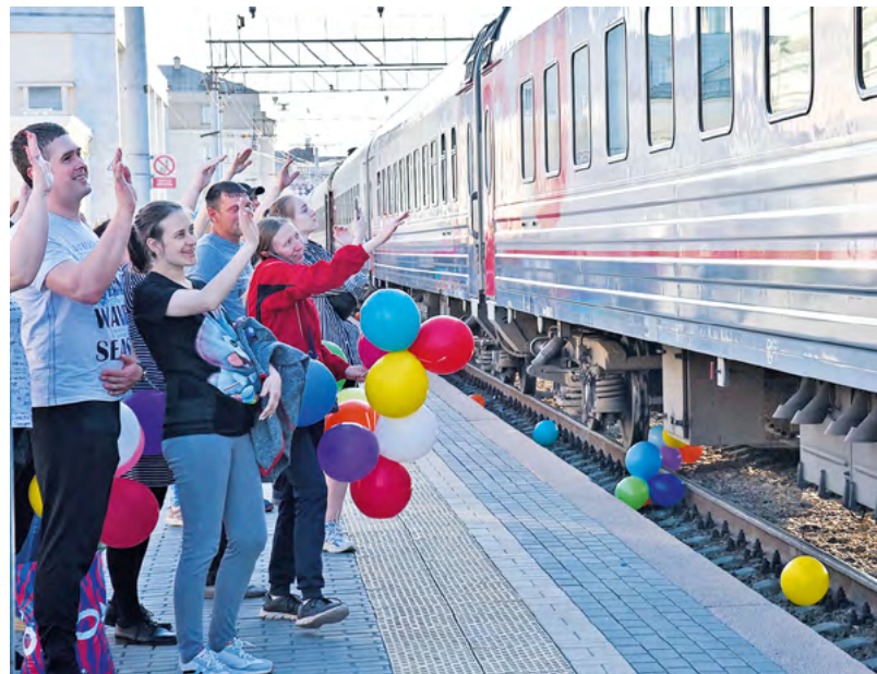
Отправление первого в сезоне «Поезда здоровья»