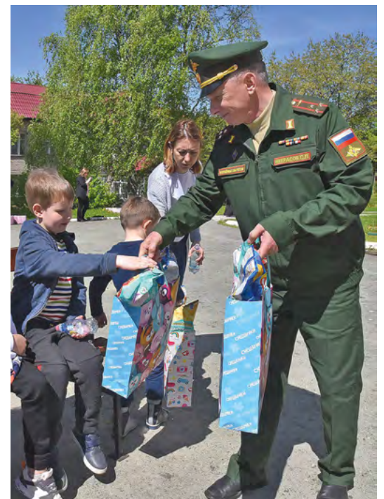
▲ Военнослужащие Центрального военного округа вручили подарочные наборы детям, которые покинули Донбасс. Праздничные мероприятия прошли в пункте временного размещения, где сейчас живут семьи с Донбасса. Фото: Борис Ярков

▼ В Екатеринбурге сдали в эксплуатацию самую большую автоматизированную котельную. Она будет обеспечивать теплом и горячей водой все объекты строящегося микрорайона Новокольцовский. Суммарный объем инвестиций в проект составил почти один миллиард рублей. Фото: Борис Ярков