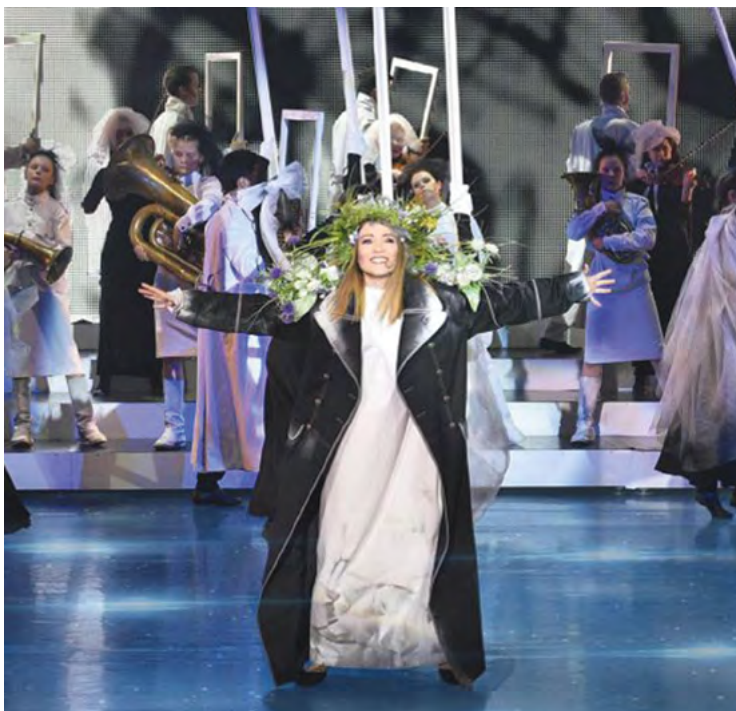
▲ Артисты Уральского театра эстрады и студенты Екатеринбургского театрального института примут участие в XXIV Международном фестивале античного искусства «Боспорские агонии», который пройдет в городе Керчи с 10 по 16 июня. В рамках фестиваля уральские артисты представят два проекта — «Город древний, город длинный» и спектакль-балладу «Героям былых времен».