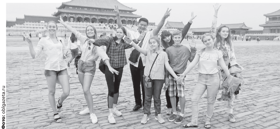
В этом году пять уральцев осуществили «китайскую мечту», в следующем — счастье попытают другие ребята.

Вернисаж эмоций и вкусов, культур свердловских студентов и школьников, побывавших в Китайской Народной Республике. Изучая китайский язык, они сделали первый шаг к мечте о международном сотрудничестве. Мнением о том, какой опыт можно перенять у жителей Поднебесной, юные уральцы поделились с «УР».