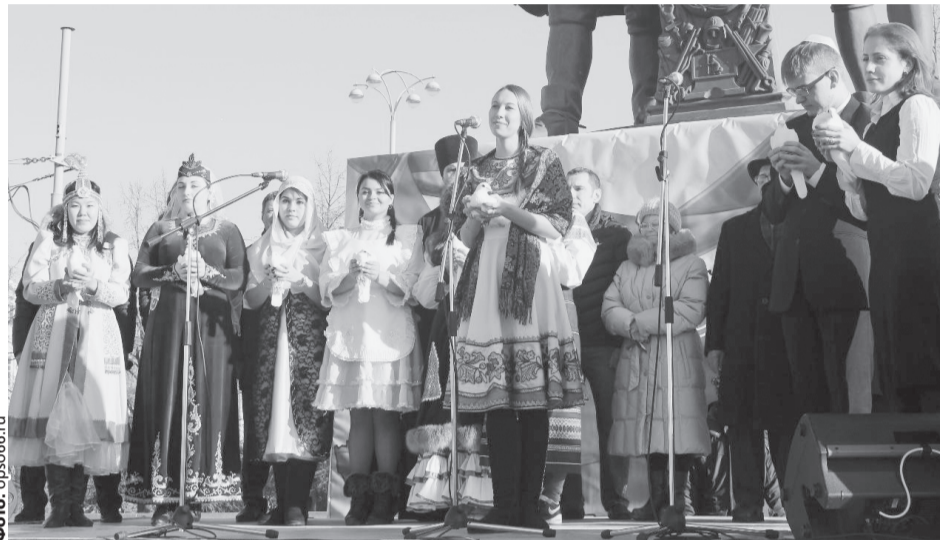
В Свердловской области в дружбе и добром соседстве проживают представители 160 национальностей.

– Одним из ярких мероприятий можно назвать традиционный Фестиваль национальных культур. Чем он будет интересен зрителю?