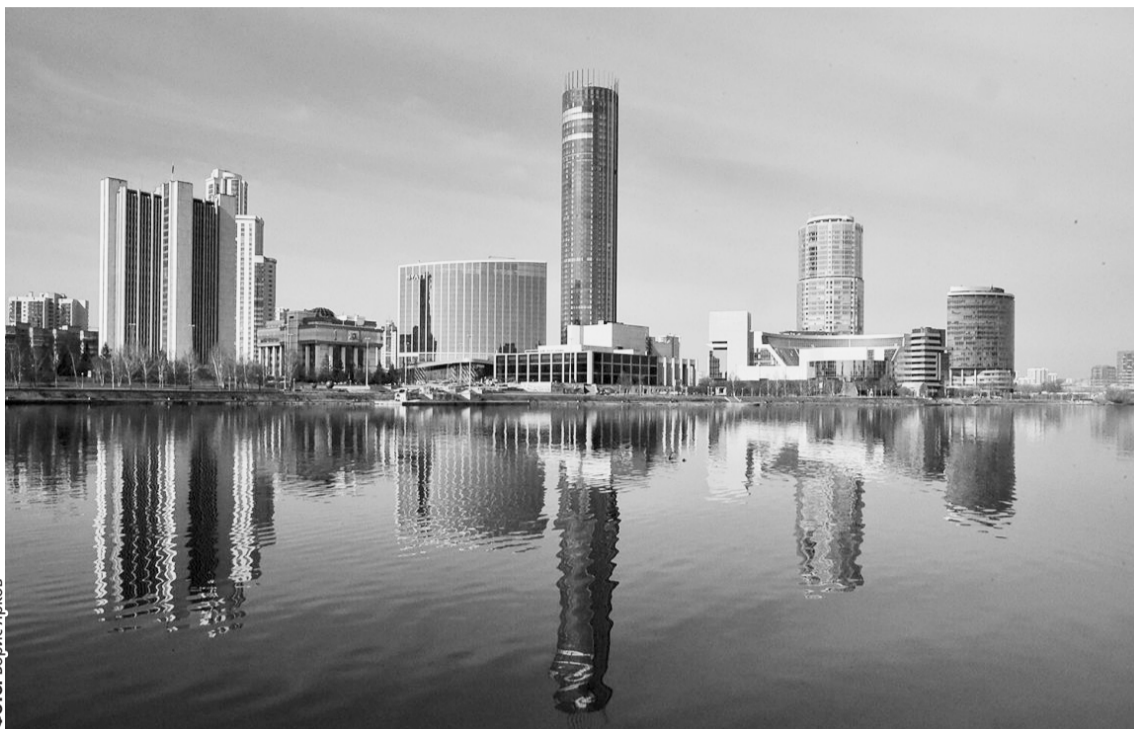
Свердловская область входит в первую десятку российских регионов.

За пять лет в уральской столице проведено техперевооружение производства реанимационного и анестезиологического оборудования на Уральском оптико-механическом за-