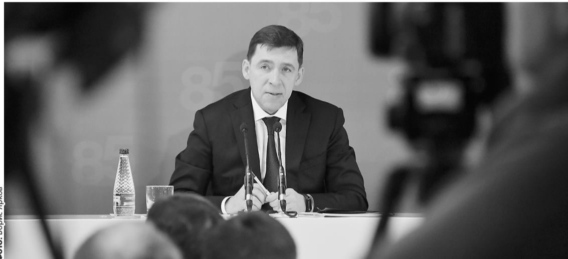
Главное для нас — улучшить качество жизни уральцев, считает губернатор.

— Об Урале и о Екатеринбурге узнали во всем мире, нами заинтересовались иностранные компании, которые хотят размещать в Уральском регионе свои производства. Это важное достижение. Что касается ЭКСПО-парка, то мы сейчас продолжаем реализацию этого проекта, к работе были подключены лучшие