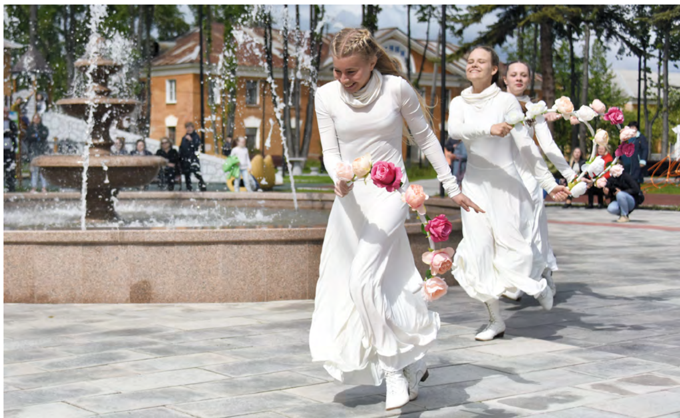
Торжественное открытие «Набережной огней» в Верхнем Тагиле

«Набережная огней» уже стала символом города, как городской сквер и площадь Победы, также реконструированные благодаря проекту «Формирование комфортной городской среды».