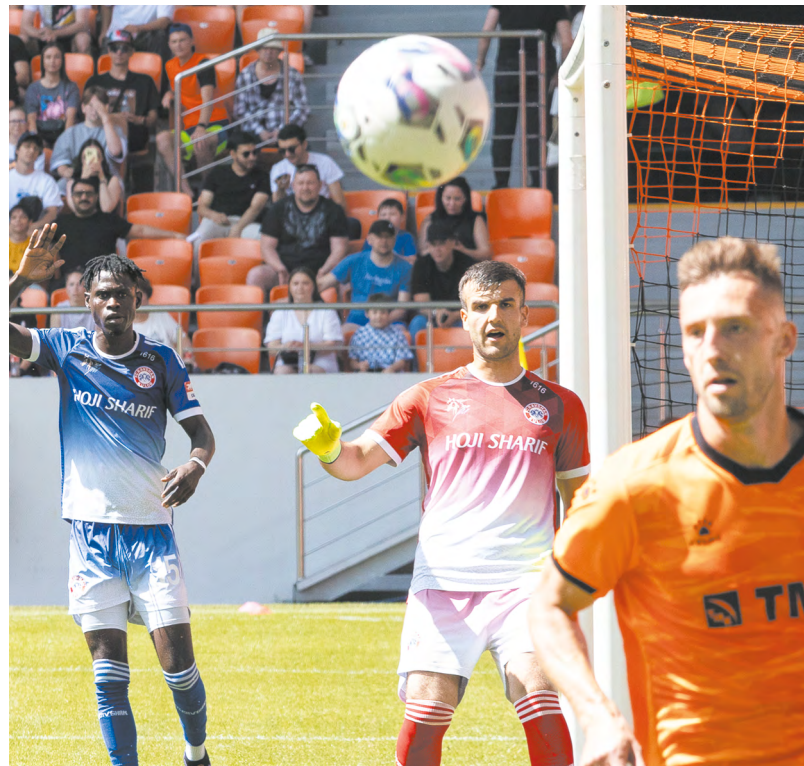
▲ «Урал» одержал победу со счетом 5:0 над «Равшаном» из Таджикистана в первом матче Кубка «Иннопрома».