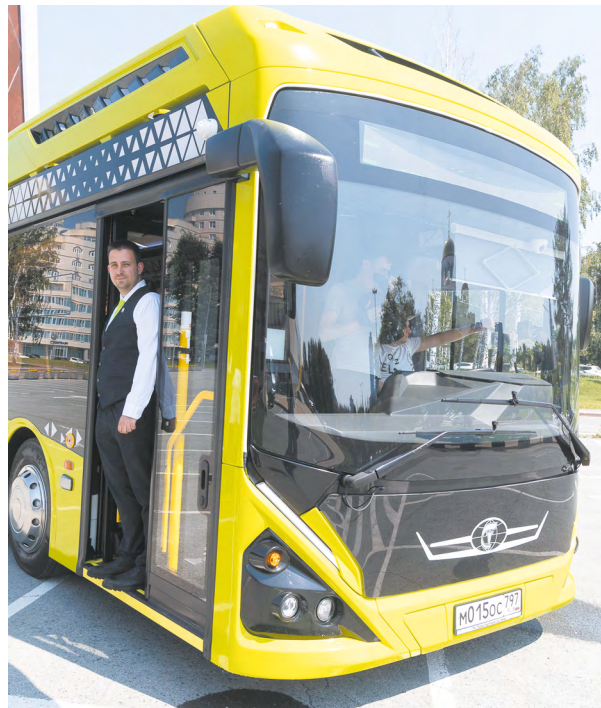
▲ На улицы Екатеринбурга на обкатку вышел электробус «Генерал». Фото: Елена Ельцова

▼ Выставка «Переплетение судеб... Страницы Первой мировой» открылась в музейно-выставочном центре «Дом Поклевских-Козелл». Фото: Елена Ельцова