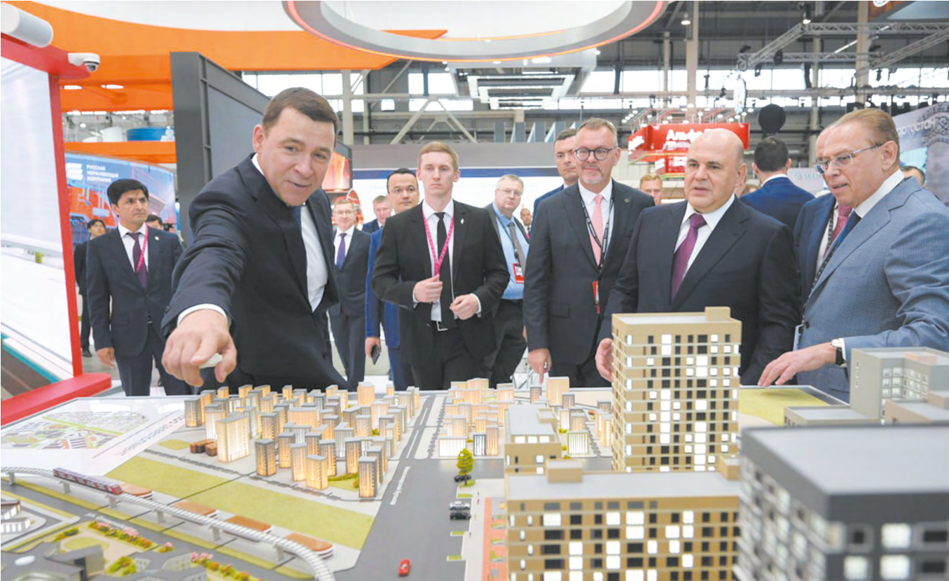
▲ Евгений Куйвашев рассказал прибывшему на «Иннопром» главе российского правительства Михаилу Мишустину о достижениях Свердловской области.