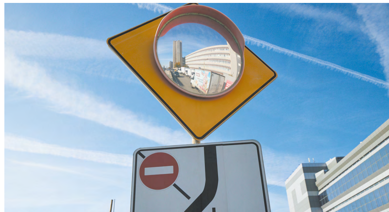
В 2024 году в местах концентрации ДТП и на потенциально аварийно-опасных участках появятся 58 комплексов автоматической фиксации нарушений ПДД.

одной из ключевых артерий на юге Екатеринбургской агломерации — автодороги из областного центра в Полевской. Поручение по проведению работ дал Евгений Куйвашев после прямой линии в декабре прошлого года.