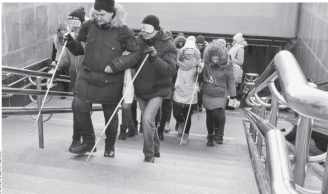
Участники флеш-моба поделились с «УР» впечатлениями от пути с повязкой на глазах. Они отметили некомфортные ощущения и незащищенность перед невидимыми препятствиями: «Еще больше понимаешь людей с белой тростью, нуждающихся в доступной среде».

«В городе действует муниципальная программа «Доступная среда». Проекты новых зданий и сооружений, а также объекты капитального ремонта предусматривают возможность беспрепятственного доступа в них незрячих и слабовидящих людей», — отметил Михаил Войцеховский.