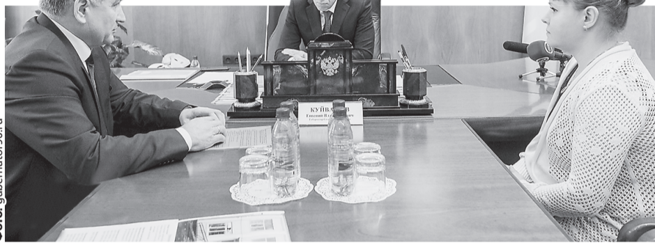
Личный прием граждан губернатором по поручению Президента РФ проходит раз в полгода.

Глава Среднего Урала Евгений Куйвашев в ходе приема граждан, который прошел 13 ноября, дал министерствам и ведомствам ряд поручений, касающихся строительства и ремонта образовательных учреждений, содействия в переселении из аварийного жилья, восстановления дороги в Горноуральском городском округе и плотины в Новолялинском районе.