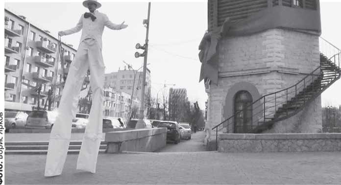
Датой рождения столицы Урала считается 18 ноября 1723 года. Тогда на заводе впервые запустили ковочные молоты.

Водонапорная башня на Плотинке — памятник архитектуры федерального значения. Она была построена в 1880-х годах для обслуживания железнодорожных мастерских, расположенных на месте бывшего Екатеринбургского монетного двора и Екатеринбургской казенной механической фабрики. Изначально цели было две — заправлять котлы паровозов водой и