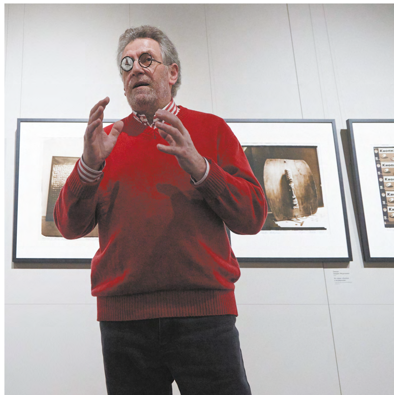
▲ Выставка «Кнопка и модернизм» Андрея Чежина из Центра визуальной культуры Béton открылась в Екатеринбургском музее изобразительных искусств.