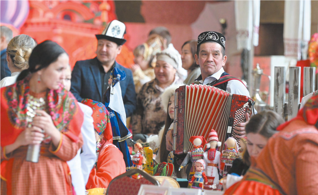
▲ На Среднем Урале тысячи свердловчан приняли участие в праздничных мероприятиях, посвященных Дню народного единства.