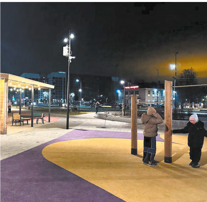
▲ В Березовском открыли самую большую благоустроенную улицу площадью около трех гектаров.