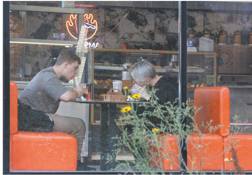
Рестораторам приходится постоянно искать баланс между качеством и ценовой доступностью продуктов, следить за сменой концепций в сфере общепита.

Будущее ресторанного бизнеса связано не только с меняющимися особенностями концепций общепита, но и с работой с поставщиками. Себестоимость блюд растет. И рестораторы отмечают, что приходится постоянно искать баланс между качеством и ценовой доступностью. Облегчают работу налаженные и проверенные связи с местными производителями. И в качестве опоры для обеих сторон может выступить еще одно звено — господдержка фермерства как одного из ключевых сегментов малого и среднего бизнеса.