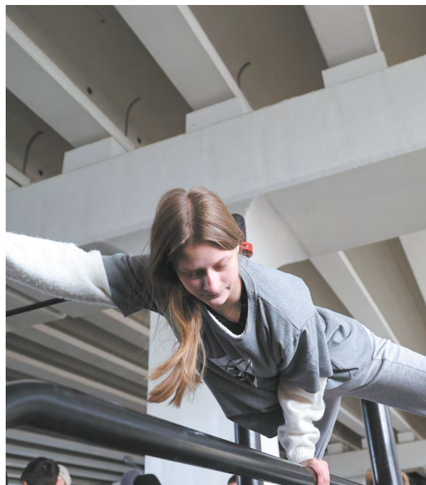
▲ В Екатеринбурге под Макаровским мостом появилась воркаут-площадка, созданная с учетом пожеланий горожан.