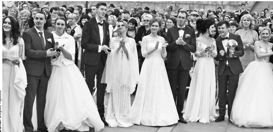
В Историческом сквере пройдет Городская свадьба

Наконец, 16 и 17 августа в КРК «Уралец» (улица Большакова, 90) любители