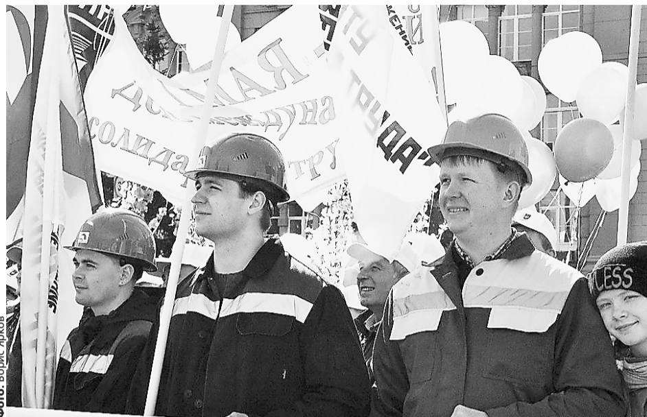
Федерация профсоюзов Свердловской области объединяет более 650 тысяч работающих уральцев.

– Согласны ли вы с утверждением, что сегодня профсоюзам стало