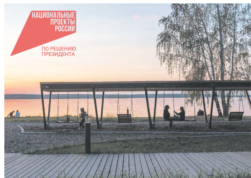
Свердловчане видят дворы, аллеи и другие пространства, которые меняются к лучшему по федеральной программе. Поэтому всеми силами поддерживают ее!