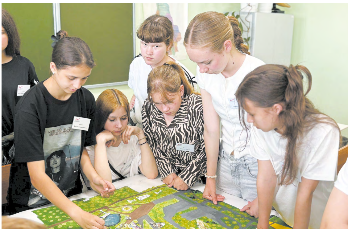
Студенты-целевики помогут поддержать и развить отрасль сельского хозяйства

— Целевое обучение — эффективная система подготовки кадров, которая набирает популярность среди абитуриентов.