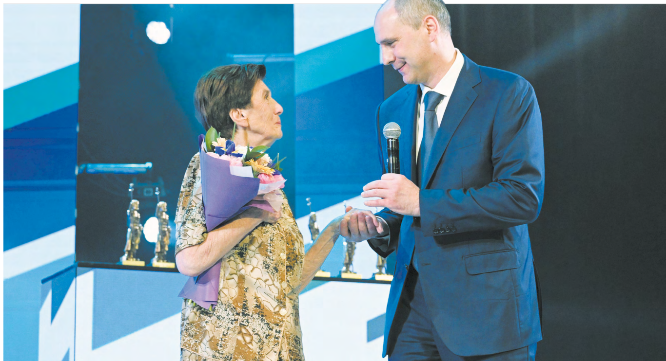
▲ Десять медицинских работников и семь учреждений здравоохранения Свердловской области удостоены престижной премии «Медицинский Олимп»