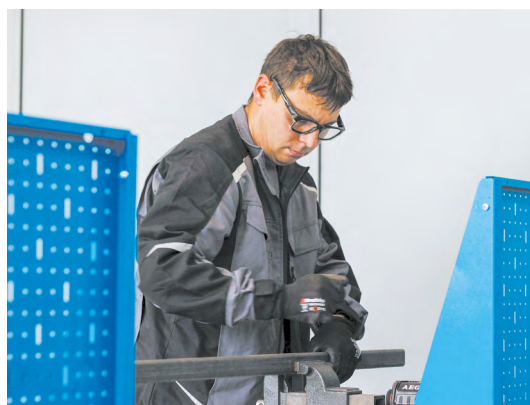
▲ Ювелиры крупного калибра: состоялся областной конкурс профессионального мастерства «Славим человека труда!» в номинации «Лучший слесарь-сборщик»