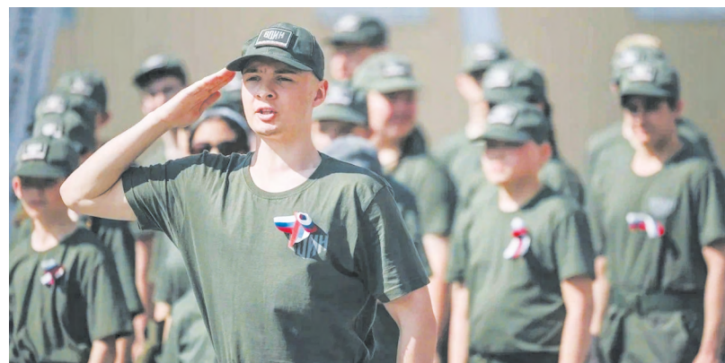
▲ В регионе стартует проект «Время юных героев». 400 подростков Свердловской области станут участниками летних смен Центра «ВОИН»