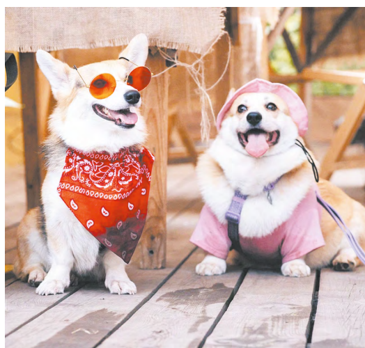
▲ Когда завод «виляет хвостом»: в Сысерти прошел большой дог-френдли фестиваль