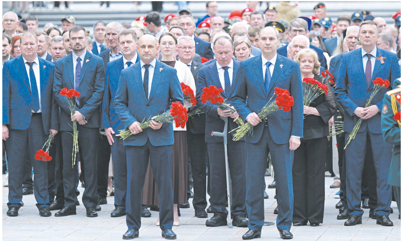
Полпред Президента РФ в УрФО Артем Жога и губернатор Свердловской области Денис Паслер на церемонии возложения цветов к Вечному огню на Широкореченском военно-мемориальном комплексе

Новые школы, центры для досуга, гранты, премии и стипендии, беспрецедентные меры поддержки студенческих семей — далеко не полный перечень того, что делается для молодежи на Среднем Урале. Созданная система работает потому, что сама молодежь включается во все процессы энергично и с инициативой.