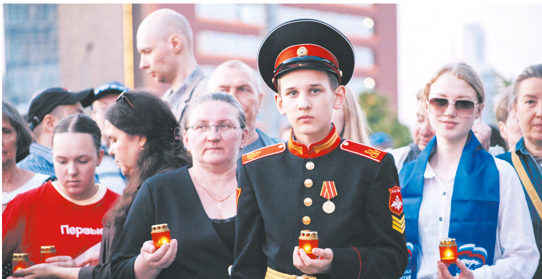
Урал помнит: в акции «Свеча памяти» в уральской столице поучаствовали сотни неравнодушных к трагической дате...

и соединений, в том числе знаменитый Уральский добровольческий танковый корпус, были сформированы в годы Великой Отечественной войны на уральской земле