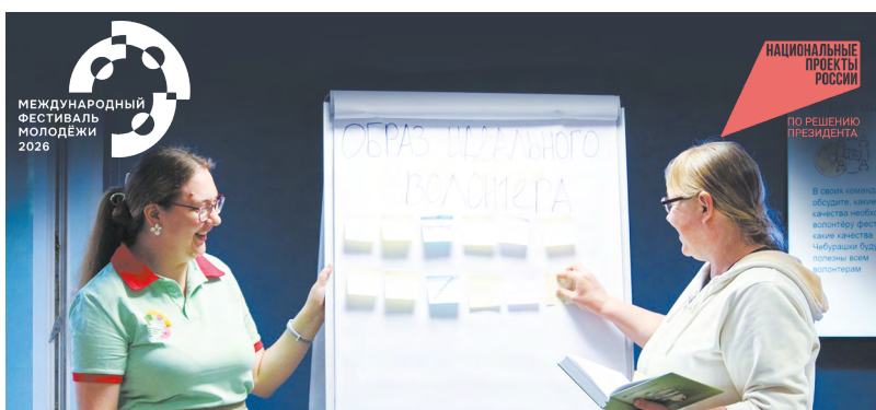
Волонтеров в преддверии фестиваля «вооружат» знаниями, которые позволят им стать образцовыми помощниками для тысяч гостей из множества стран