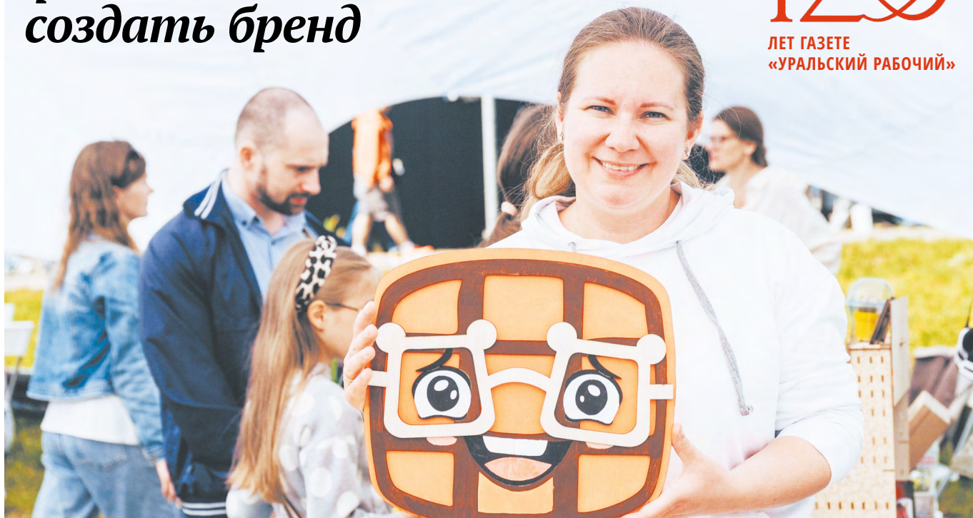
В этой семье мама рисует, папа настраивает оборудование, а девятилетняя дочь помогает родителям учить детей на мастер-классах