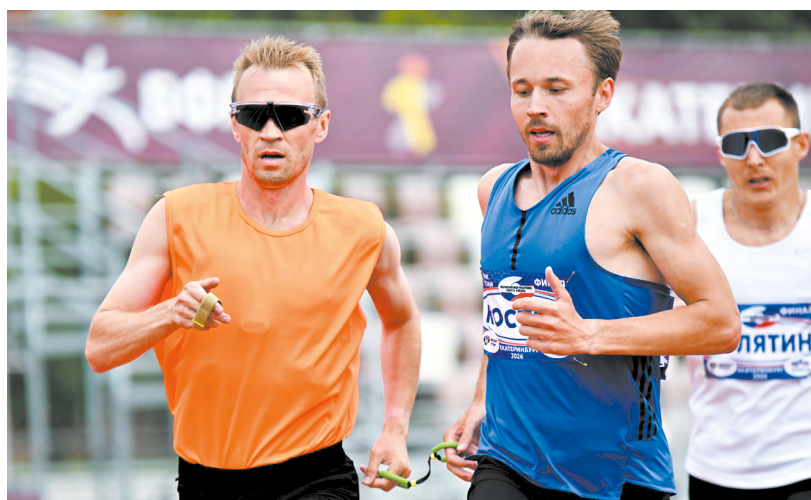
▲ Видеть цель сердцем. В Екатеринбурге прошел финал Кубка России по легкой атлетике для слепых