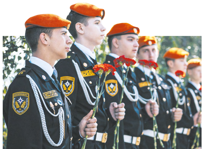
Акция «Во имя жизни» в центре уральской столицы стала важной частью Дня памяти и скорби