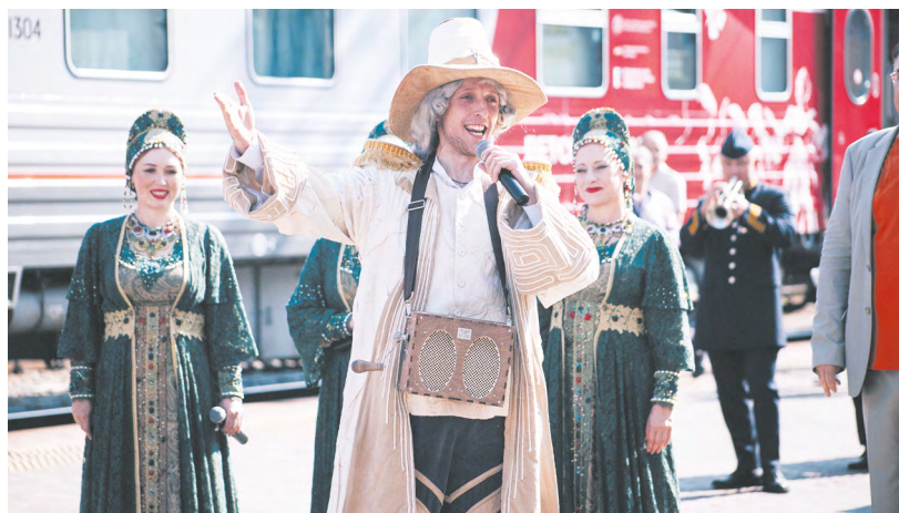
▲ Спектакль начинается с перрона: как уральская столица встречала «Театральный поезд»