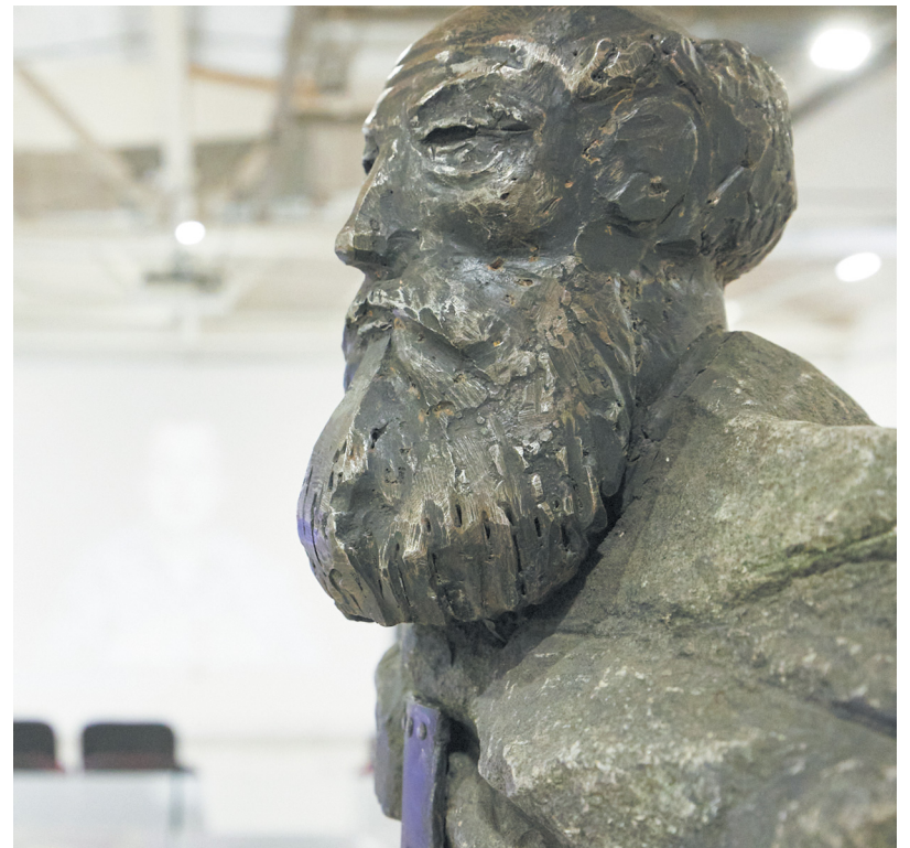
▲ В Екатеринбурге открылся международный выставочный проект «Демидовы XIX века: патриоты и космополиты».