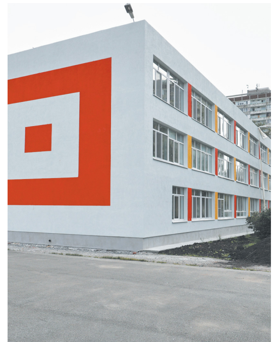
▲ В Екатеринбурге завершается реконструкция школы №140.