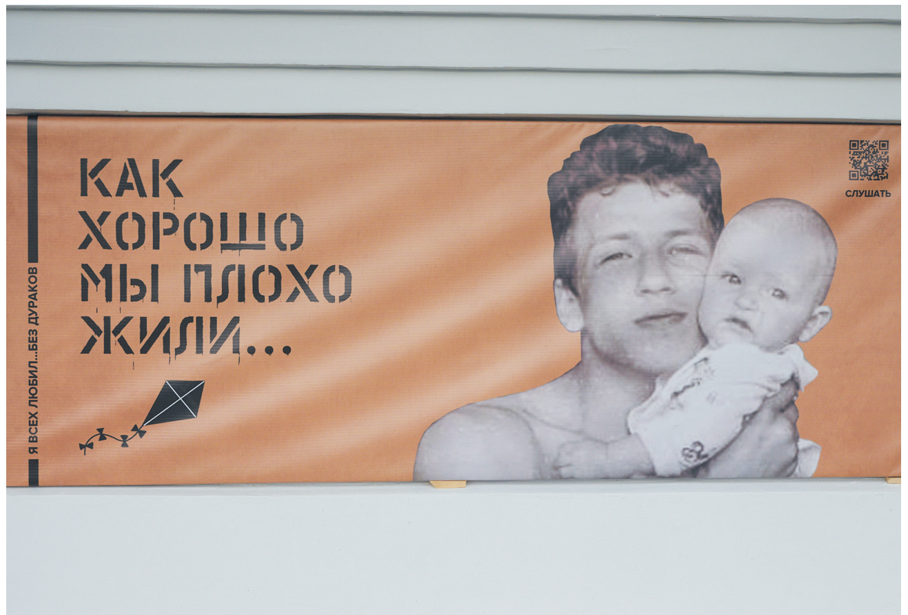
▲ Забор в Литературном квартале украсили строками из стихотворений Бориса Рыжего.

Напомним, выборы в Свердловской области проходили 9 и 10 сентября. Правом проголосовать обладало свыше 1,3 миллиона избирателей.