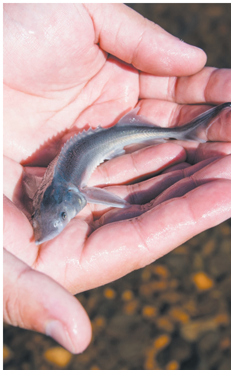
▼ В реку Лозьва выпустили более 10 тысяч мальков стерляди.