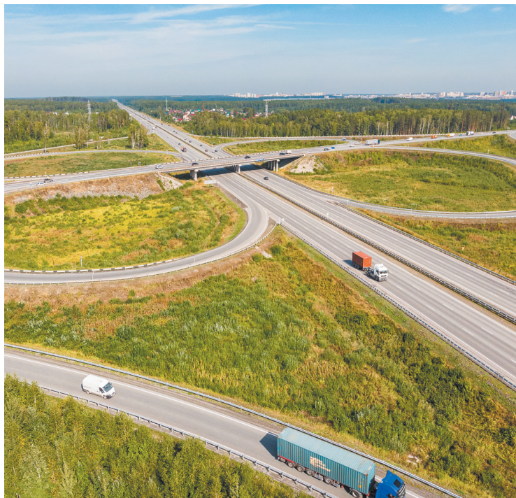
▲ ЕКАД исполнился год.