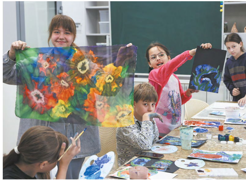
Более ста тысяч школьников смогут летом отдохнуть в городских лагерях.

участии инвесторов один такой лагерь, работающий в течение года, будет построен около Сысерти, еще два — в Камышлове и Шале — заработают в 2029 году. В каждом из них одновременно смогут отдыхать 500 школьников. По словам заместителя губернатора Дмитрия Ионина, участие инвесторов поможет ускорить процесс развития системы современных вселетних мест детского отдыха.