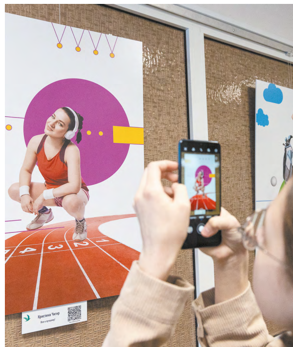
▲ Люди, которые борются с онкологическими заболеваниями, стали героями проекта «Спорт для жизни».