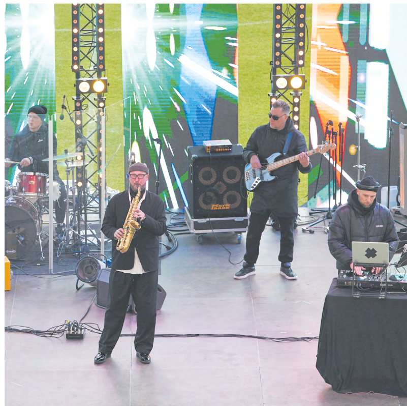
▲ На «Екатеринбург Арене» впервые прошел концерт Open mind.