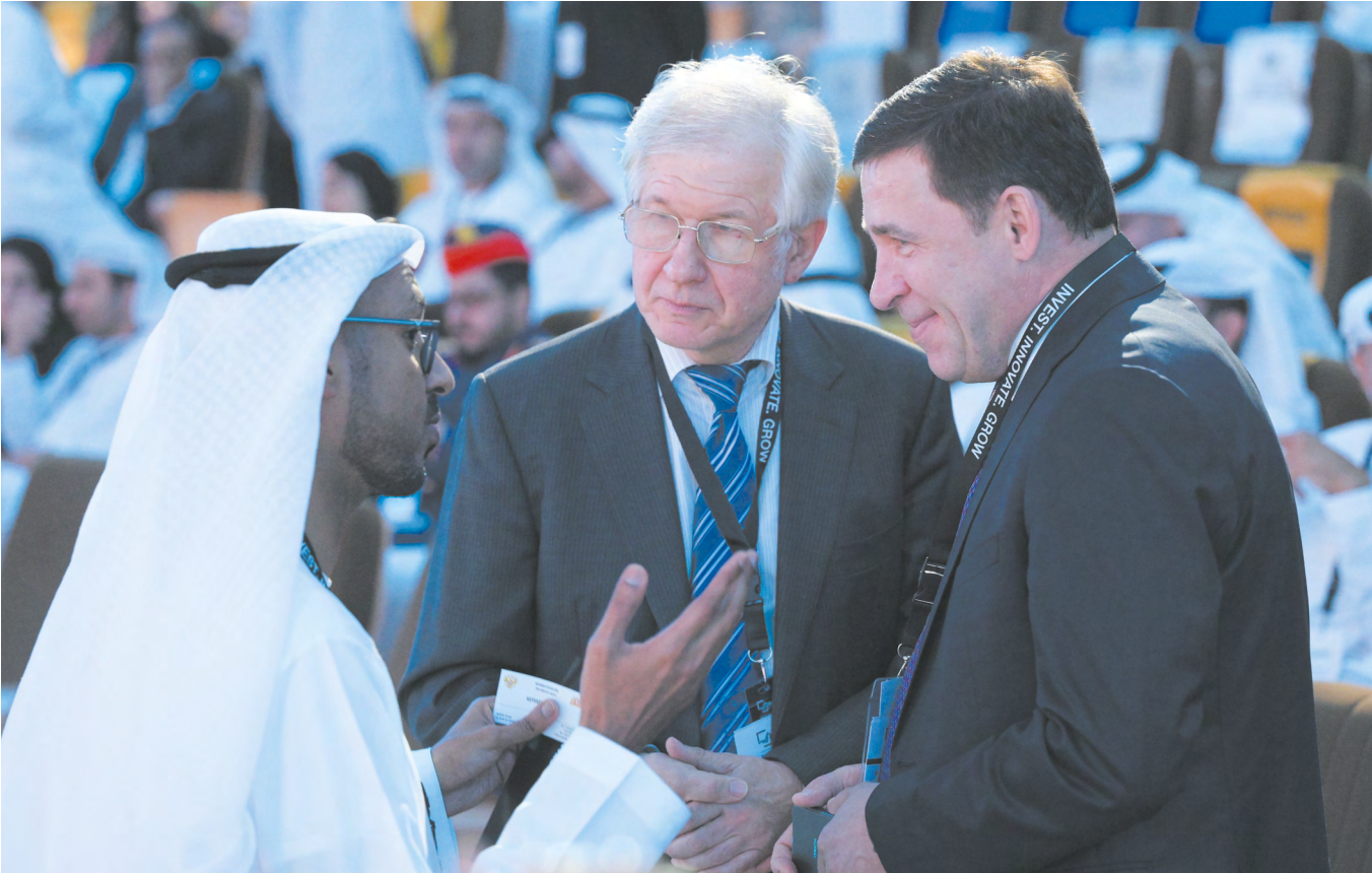
▲ Губернатор Евгений Куйвашев принял участие в Make it in the Emirates Forum в ОАЭ.