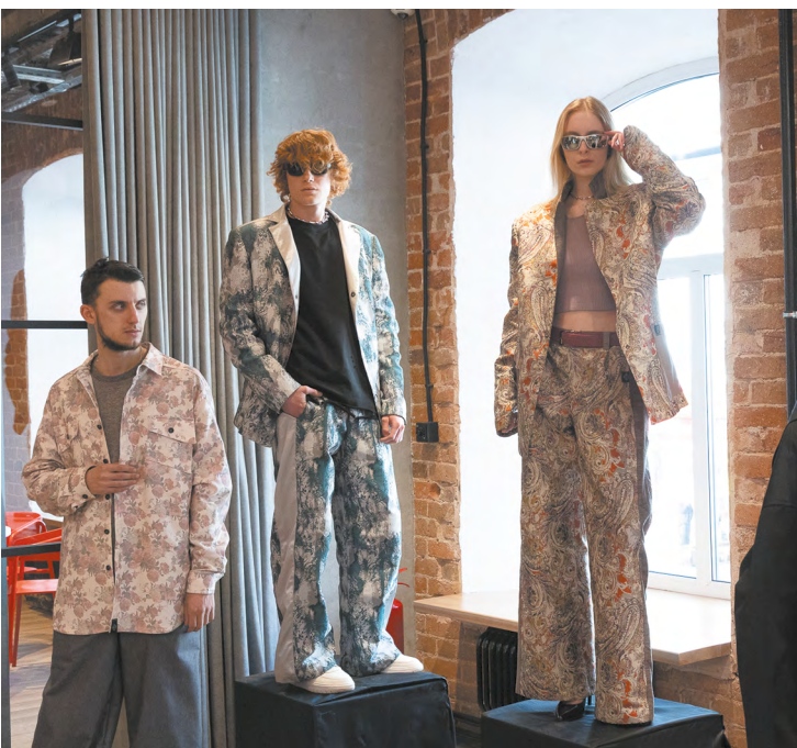
▲ В «Домне» состоялась презентация международного проекта U'Fashion, который призван сделать столицу Урала точкой притяжения для креативной аудитории и помочь уральским дизайнерам в продвижении бизнеса.