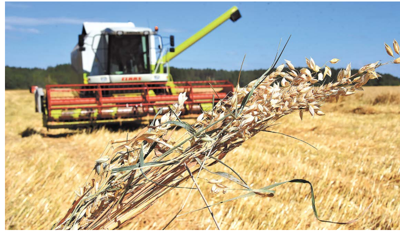
Урожайность зерновых оказалась выше уровня прошлого года в полтора раза, составил 28,5 центнера с гектара

картофель», реализуемой в регионе с 2018 года. Здесь выполняют полный цикл производства семенного картофеля уральской селекции, хозяйство рассчитывает обеспечивать семенными клубнями не только свой регион, но и соседние.