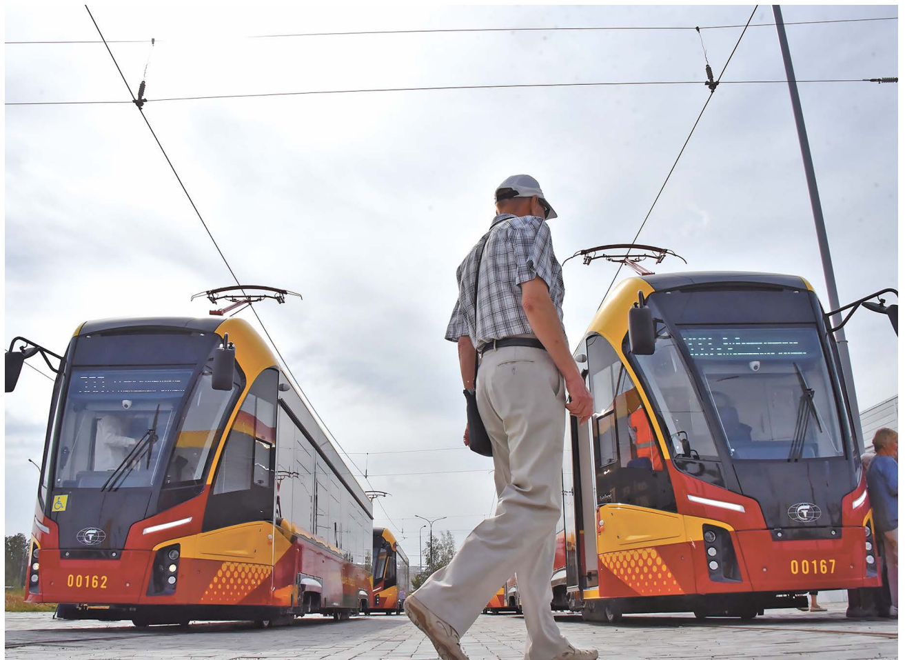
▲ За месяц работы «Львята» перевезли по маршруту Екатеринбург – Верхняя Пышма 116,7 тысячи пассажиров.