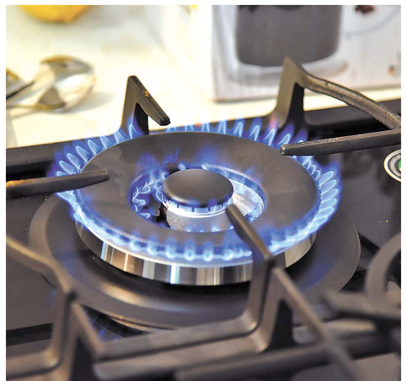
▲ До конца года 55 многоквартирных домов Свердловской области получат «голубое топливо».