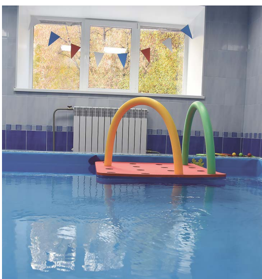
▲ В Екатеринбурге в детском саду № 348 открылся бассейн. Утром в нем будут плавать воспитанники, а вечером — все желающие малыши.