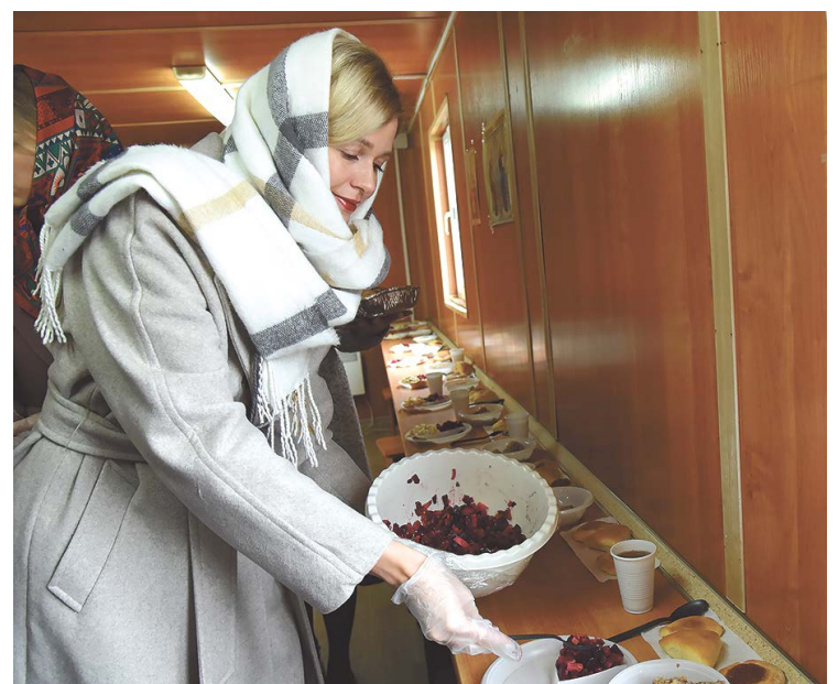
▲ Участницы конкурса «Главная мама Екатеринбурга – 2022» устроили благотворительную акцию и приготовили обед для малоимущих.