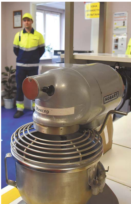
▲ Завод «Сен Гобен» в Полевском планирует вложить в развитие 70 миллионов рублей и увеличить выпуск строительных смесей.