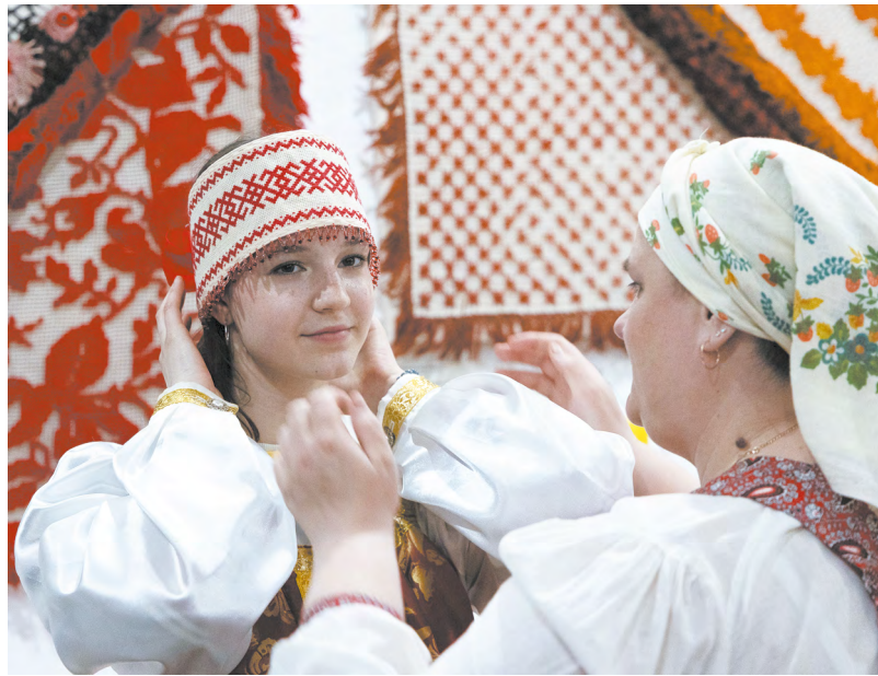
На рост туристического потока влияет не только развитие инфраструктуры, но и увеличение количества культурно-развлекательных мероприятий.

По «Демидовскому маршруту», который, по данным Ассоциации туроператоров, занял седьмую строчку в рейтинге самых востребованных национальных маршрутов, можно проехать в трех форматах: однодневным, двухдневным и трехдневным туром. Это первый национальный туристский маршрут по Свердловской области, который не только рассказывает о наследии династии Демидовых. Во время путешествия можно попробовать настоящий «обед металлурга», посетить цеха крупнейшего металлургического комбината и научиться расписывать знаменитые Тагильские подносы.