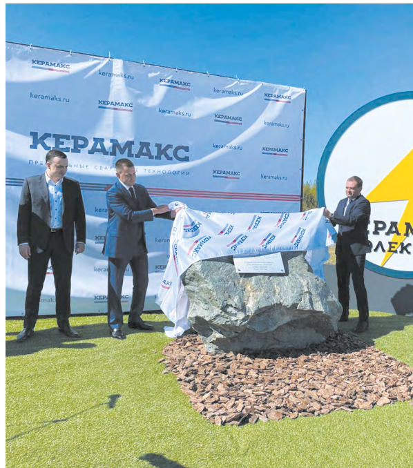
▲ Началось строительство завода «Керамакс-Электра», который будет выпускать премиальную сварочную и металлургическую продукцию.