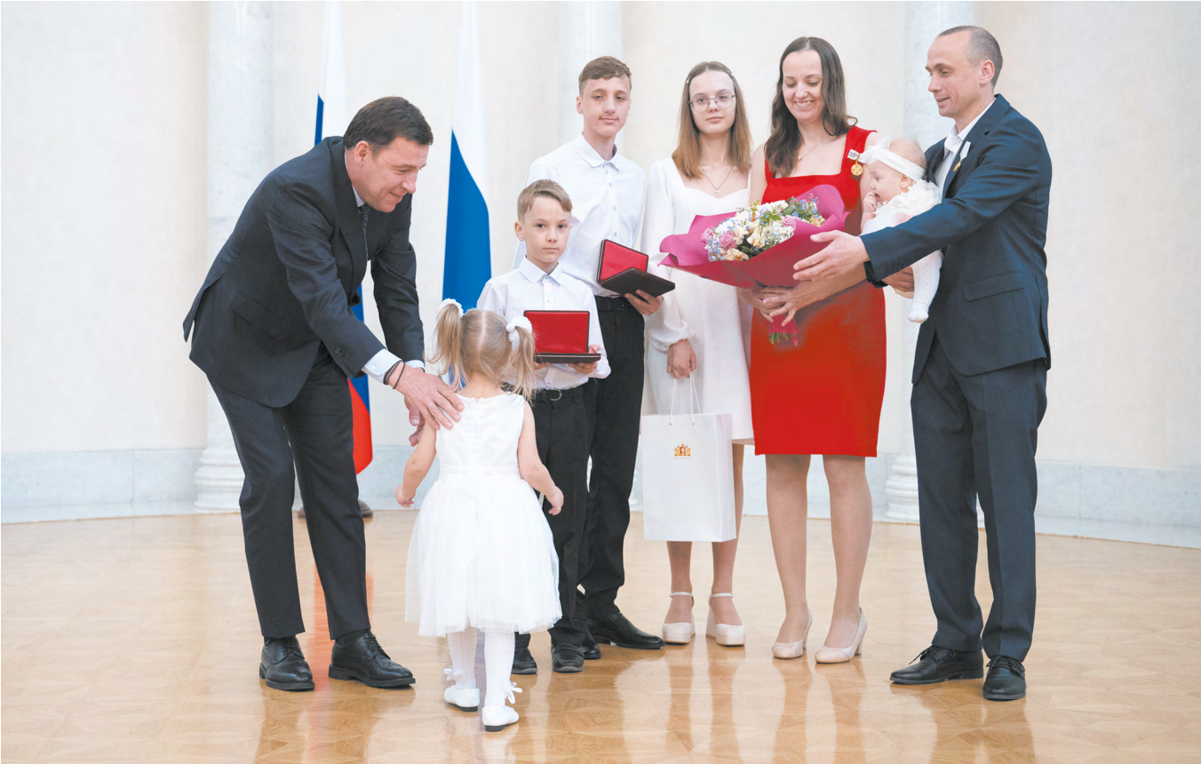
▲ Евгений Куйвашев вручил государственные награды шести многодетным свердловским семьям.