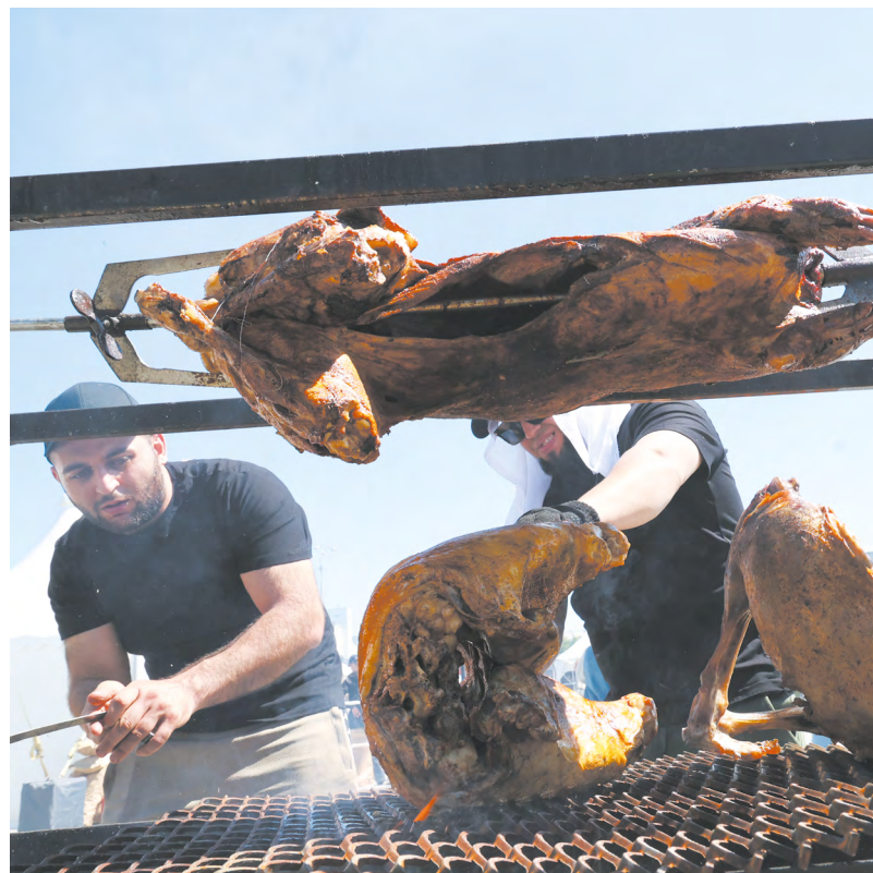
▲ Фестиваль барбекю открыл сезон летнего отдыха на Среднем Урале.