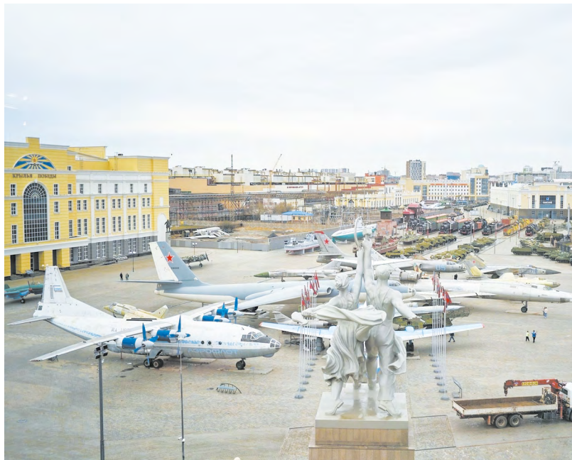
Музейный комплекс в Верхней Пышме — один из номинантов конкурса