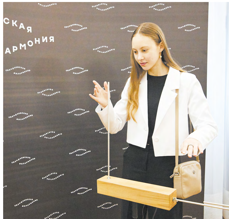
▲ Свердловская филармония представила первый и единственный в мире бесконтактный музыкальный инструмент – терменвокс.