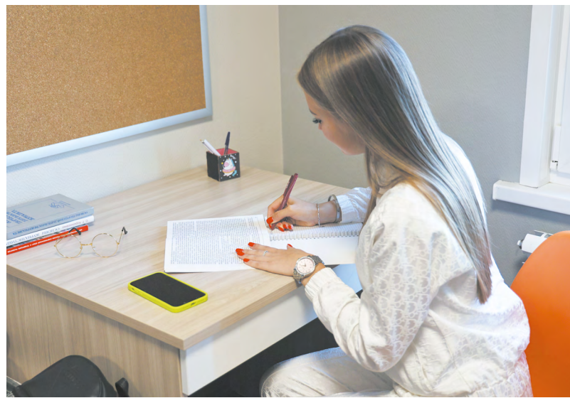
Первые 1,7 тысячи студентов в сентябре 2023 года заселились в кампус УрФУ в Новокольцовском микрорайоне Екатеринбурга.

НПО автоматике имени академика Н. А. Семихатова, построенное в 1941 году. Исследуя архитектуру того времени, мы задаемся не только вопросом, как можем вписать ее в нынешнее городское пространство, но и тем, какие современные здания будут говорить о научном потенциале нашего времени. Как сегодня выглядит наука в архитектуре? Это технопарки, коворкинги, бизнес-центры? Ответ на этот вопрос мы еще ищем», — заключил Константин Бугров.