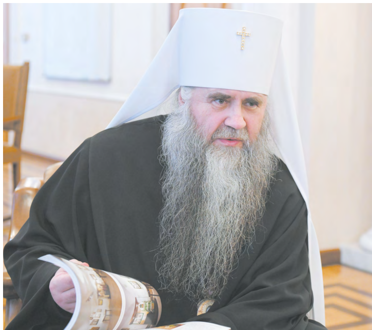
▲ Митрополит Нижегородский и Арзамасский Георгий рассказал о подворье Свято-Троицкого Серафимо-Дивеевского женского монастыря, которое открылось в Среднеуральске.