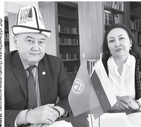
Первыми уральских ветеранов поздравили представители Генерального консульства Киргизской Республики в Екатеринбурге

Генеральное консульство Узбекистана в Екатеринбурге также записало ро-