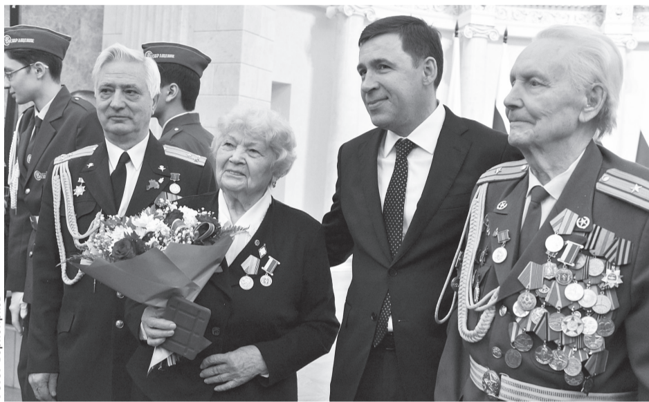
Сегодня в Свердловской области проживает около 30 тысяч ветеранов Великой Отечественной войны

На территории нашего региона было размещено более 400 крупнейших предприятий, научных институтов.