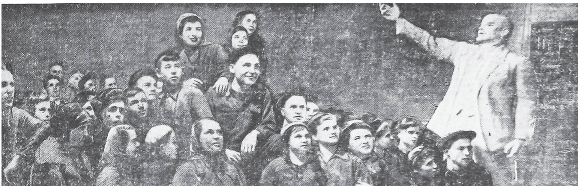
Рабочие завода слушают обращение товарища И. В. Сталина к народу