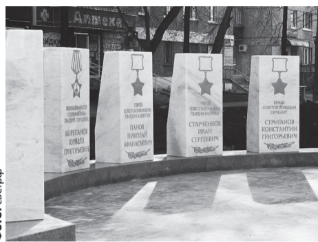
Полностью благоустройство общественной территории завершится к середине лета

Сквер Победы был разбит трудящимися города в мае 1985 года – в честь 40-летия Победы Советского народа в Ве-