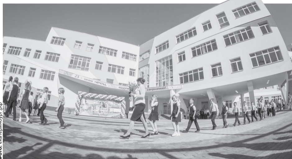
Правительство области планирует до 2020 года перевести на односменное обучение детей начальной школы и старшекласников.

— Несмотря на начало учебного года ряд объектов школьной инфраструктуры продолжает реконструироваться. Известно, что план города предусматривает построить еще нес-