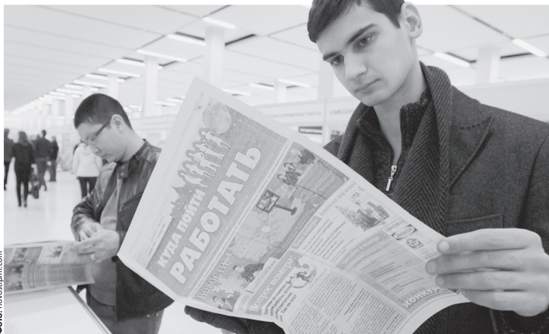
Исследования ряда кадровых агентств показали, что среди приоритетов при выборе работы на первое место россияне ставят заработную плату, на второе – карьерный рост и на третье – интересные задачи.

Вопросы трудоустройства и достойной заработной платы стоят сегодня в ряду актуальных для уральцев. При подборе кандидатов на то или иное рабочее место работодателей интересует не только об-