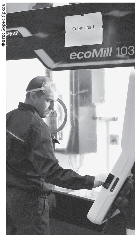
Для работы на современном станке строится программа.

Нужно отметить, что соревнования WorldSkills сегодня проводят все госкорпорации. Так, Роскосмос проводит его третий раз. Первый, в 2016 году, — в Королеве, в 2017-м — в Самаре и в этом году — в Екатеринбурге. Чем так привлекательна столица Урала? Как отметили представители НПО автоматик им. академика Н.А. Семихатова, в