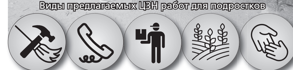
Виды предлагаемых ЦЗН работ для подростков

рии городских парков. Ребята убирают мусор, подметают дорожки, сгребают скошенную траву. Работают 2 часа, в остальное время для них организуются экскурсии, тренинги, игры. Занятость — с 9 до 14 часов. Кроме того, здесь дети получают бесплатные обеды. За месяц вместе с поддержкой службы занятости (1466 рублей) можно заработать три с половиной тысячи. При этом