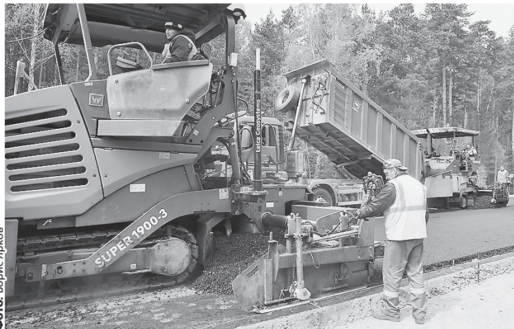
Новое покрытие дороги рассчитано на 12 лет.

Новое дорожное покрытие укладывают в три слоя: первый — это старое бетонное покрытие. Далее органно-минеральная смесь — основа будущей дороги, которая отвечает