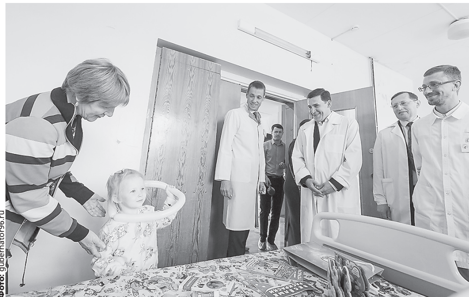
Качественная медпомощь ставит детей на ноги.

В День защиты детей, 1 июня, губернатор Евгений Куйвашев навестил пациентов Областной детской клинической больницы №1, поздравил их с праздником и осмотрел отделения медучреждения.