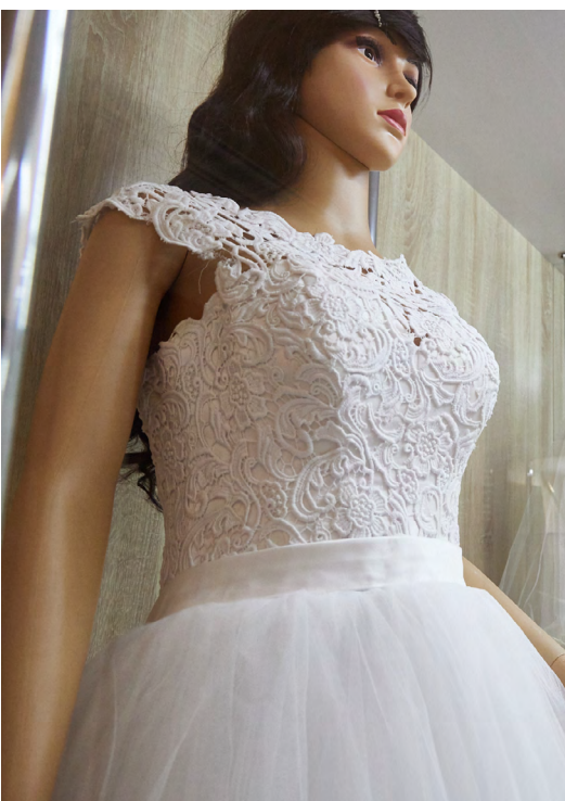
▼ В Музее истории органов ЗАГС открылся второй зал, посвященный быту 80-х годов прошлого века.