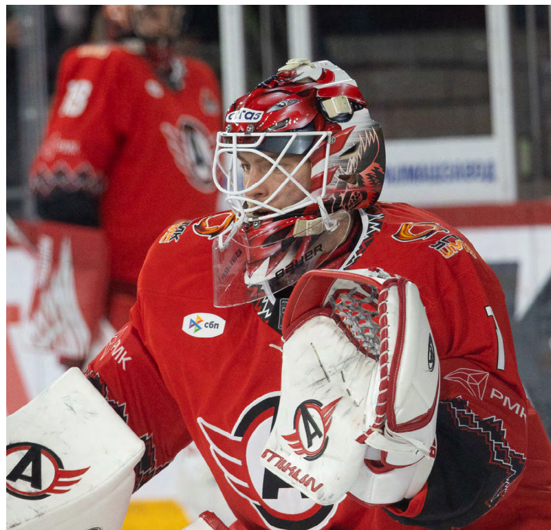
▲ «Автомобилист» после победы над «Витязем» остается в лидерах Восточной конференции.