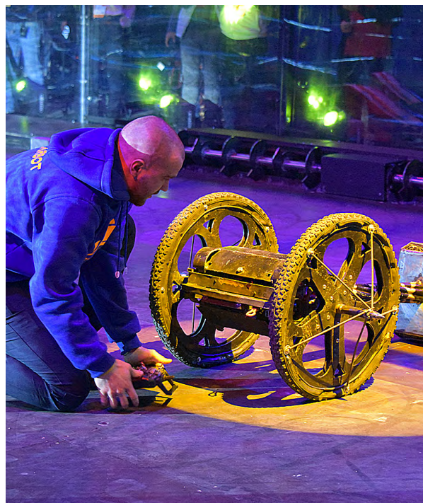
▲ Второй этап международной «Битвы роботов» в рамках IT-конгресса и выставки «Форум будущего» пройдет 26 октября в Екатеринбурге.