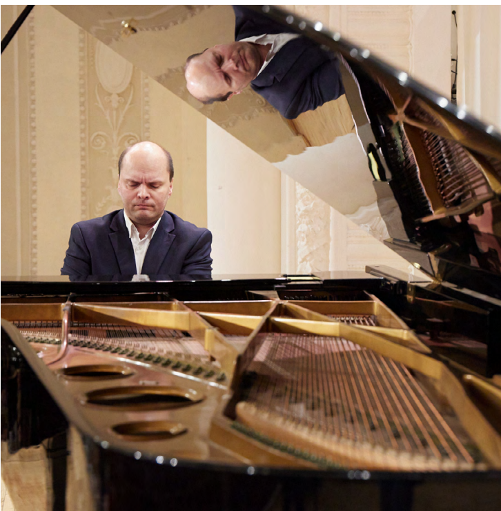
▲ На сцену свердловской филармонии спустя девять лет вернулся фестиваль фортепианных дуэтов.