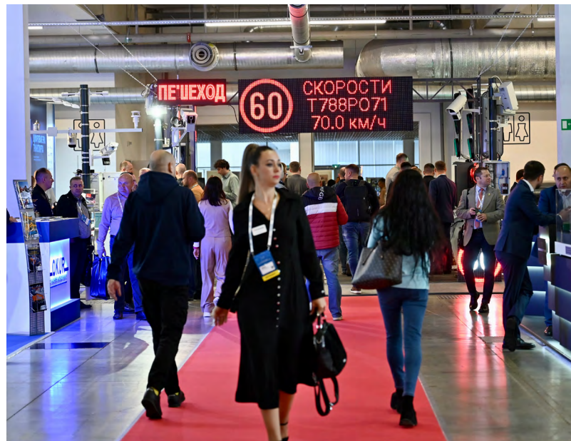
Выставка «Дорога 2024», прошедшая в МВЦ «Екатеринбург-Экспо», собрала рекордное число участников.

автодора Роман Новиков напомнил, что в этом году завершается его реализация и все целевые показатели были достигнуты.