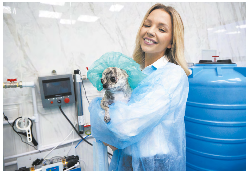
В Свердловской области на площадке технопарка «Университетский» стартовало производство косметики для кошек и собак.

Проект действует уже три года, и за это время были заключены десятки соглашений о сотрудничестве в самых разных