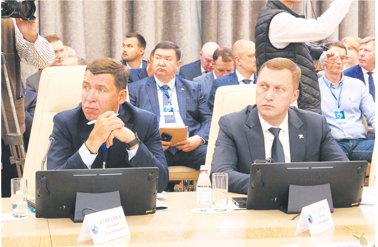
▲ Губернатор Евгений Куйвашев принял участие в работе XIX Форума межрегионального сотрудничества России и Казахстана в Костаное.

Прогнозируется, что в 2024 году доходы областного бюджета составят 407,6 миллиарда рублей. Расходы определены в сумме 423 миллиарда рублей.