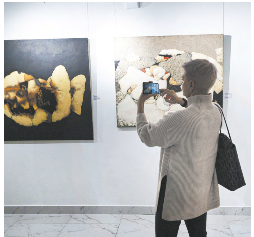
▲ В Музее андеграунда открылась персональная выставка петербургского художника Вячеслава Михайлова «Я с вами до Рождества».