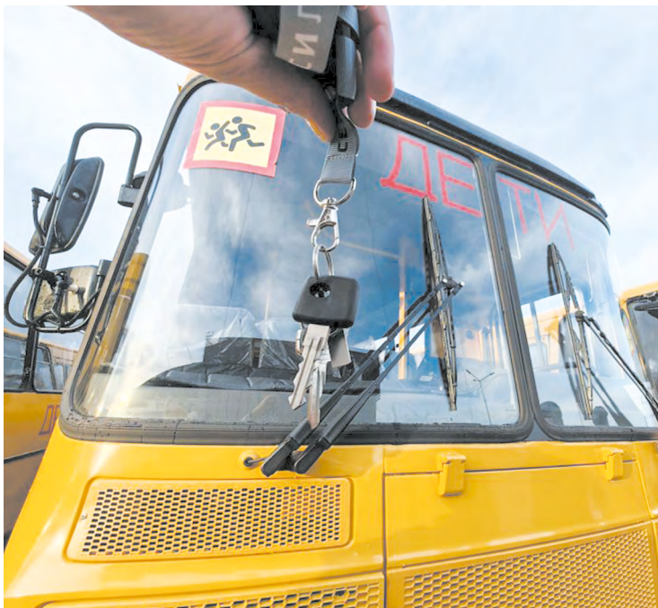
▲ Города и поселки Среднего Урала получили 15 школьных автобусов и 17 автомобилей службы скорой помощи.