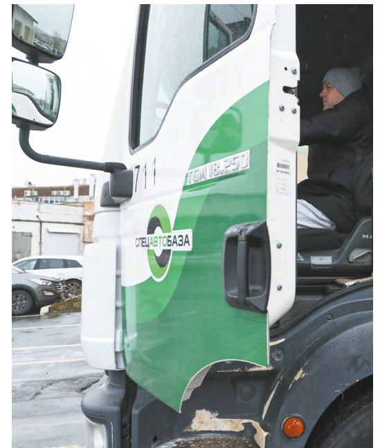
▲ В конкурсе среди водителей мусоровозов приняли участие 19 сотрудников четырех предприятий Свердловской области. Фото: Елена Ельцова

▼ Уральское главное управление Банка России, правительство области и Почта России реализуют проект по повышению доступности финансовых услуг. Фото: Елена Ельцова