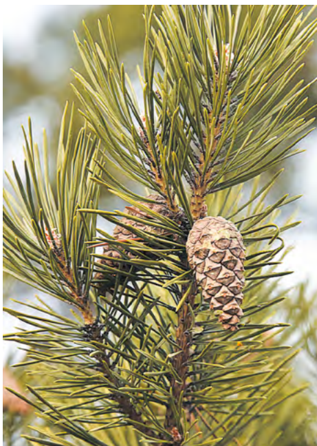
▼ Энтузиасты высадили в Лечебном микрорайоне Екатеринбурга более 1200 молодых кедров, лиственниц, пихт и сосен.