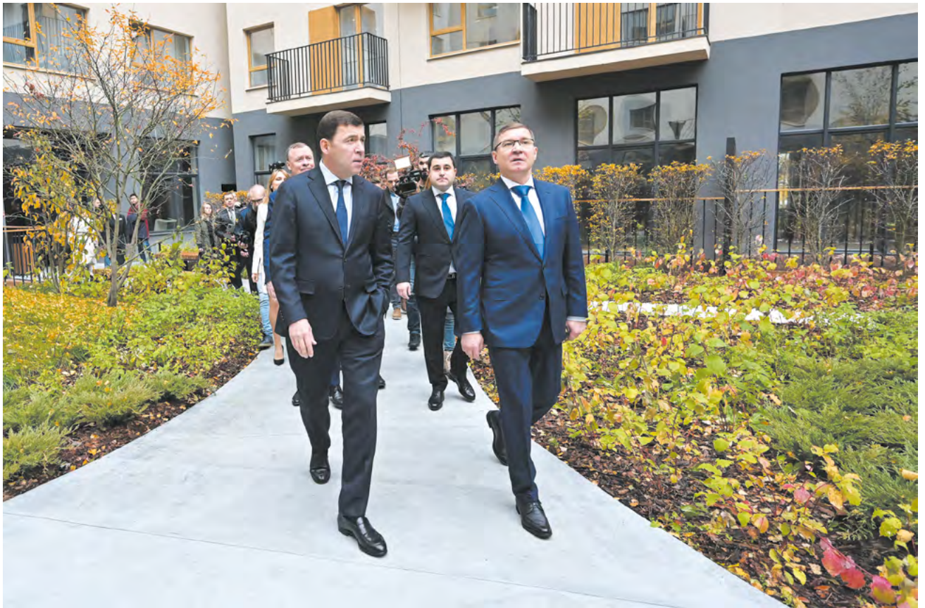
▲ Евгений Куйвашев оценил пилотный проект арендного дома в Екатеринбурге. В нем 300 квартир для долгосрочной аренды — от студий до четырехкомнатных.

Заместитель министра строительства и жилищно-коммунального хозяйства России Никита Стасишин рассказал, что в конце сентября была утверждена федеральная строительная программа на пять лет. «Основные задачи, которые она ставит перед отраслью, — сокращение в два раза объектов незавершенного строительства как жилых домов, так и инфраструктурных объектов. Еще более серьезная задача, чем строить ежегодно 120 миллионов квадратных метров жилья к 2030 году, — в полтора раза к 2027 году увеличить объем ввода объектов, в том числе инфраструктурных. На это направлен широкий набор финансовых инструментов: от инфраструктурных кредитов до программ расселения аварийного жилья и „Стимула“. Это позволит расшить как накопившиеся транспортные проблемы, так и послужит для правильного развития территорий», — отметил Стасишин.