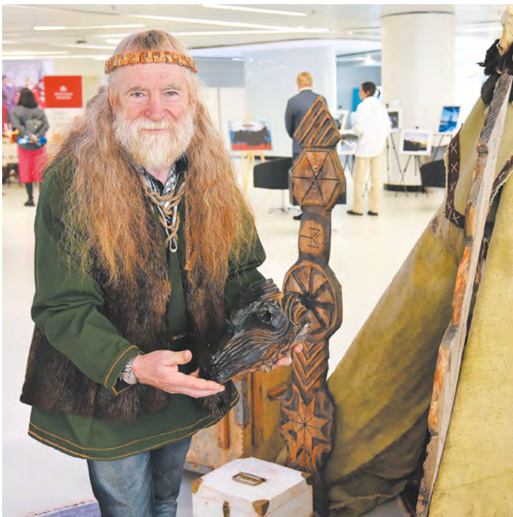
▼ В Екатеринбурге проходит международный туристский форум «Большой Урал».