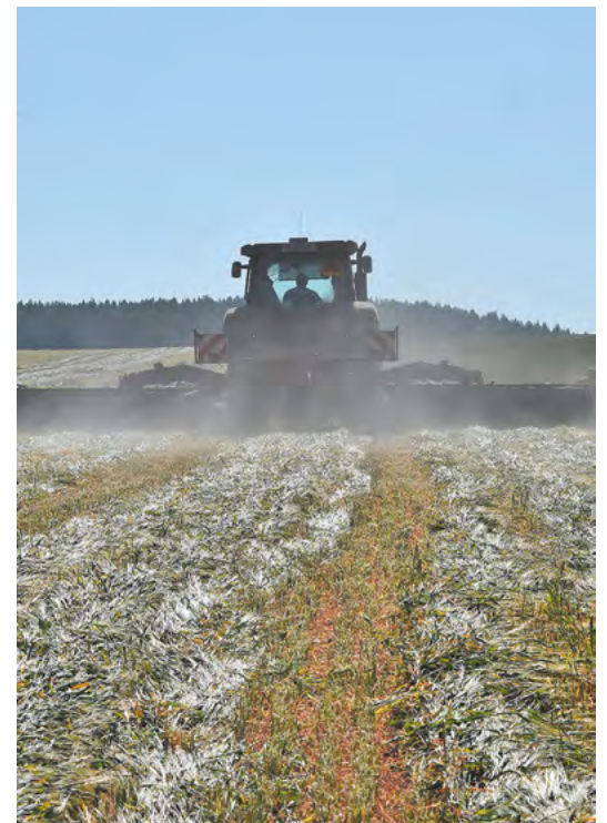
▲ Свердловские производители рапса получают господдержку в размере 26,5 миллиона рублей.