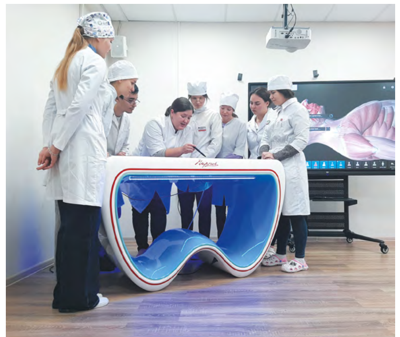
▲ Уральский медуниверситет приобрел анатомический стол «Пирогов»: теперь студенты будут изучать анатомию человека с помощью 3D-атласа.