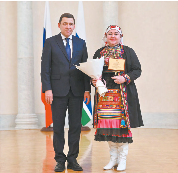
▲ Евгений Куйвашев вручил премии работникам сферы культуры Среднего Урала.

▼ Единый госэкзамен по географии и литературе досрочно сдали 67 школьников.