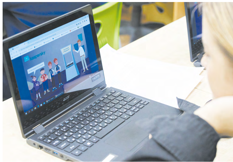
Финансовая грамотность и знания основ кибербезопасности — неотъемлемые составляющие современного образования.

«Сегодня медицина и фармацевтика — одни из самых развивающихся отраслей. Люди, которые занимаются химией и биологией, могут стать успешными бизнесменами, врачами, фармацевтами и исследователями. Первые медицинские классы мы начали создавать в 2022 году и уже видим, насколько они востребованы. Благодаря запущенной программе подобные классы будут созданы в большинстве муниципалитетов. Средства на это заложены в областном бюджете. Так, в 2024 году 90 миллионов рублей получают еще десять свердловских школ», — отметил глава региона Евгений Куйвашев.