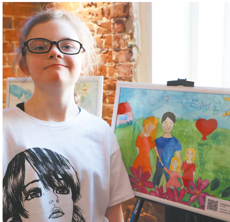
▲ В Международный день людей с синдромом Дауна в Екатеринбурге открылась выставка работ «солнечных» детей «Семья, друзья и просто Я».