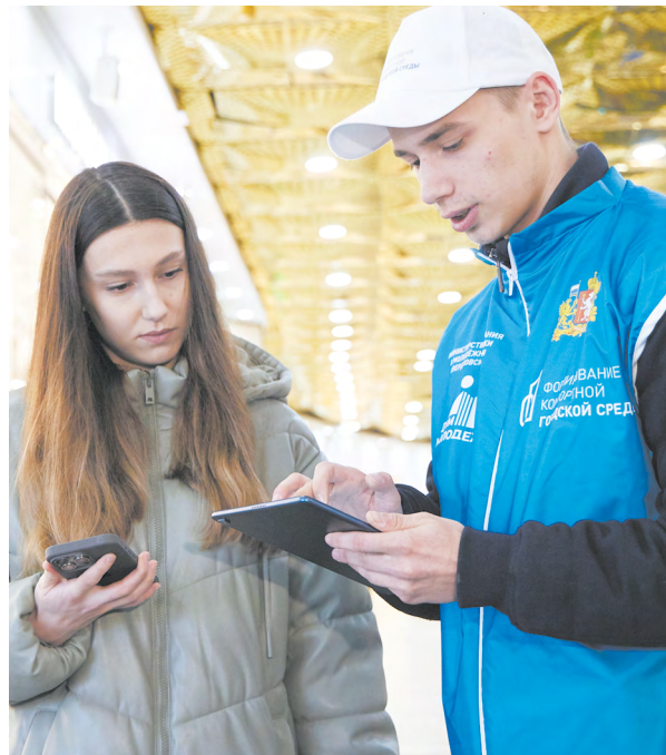
▲ Волонтеры помогают уральцам проголосовать за объекты благоустройства в рамках проекта «Формирование комфортной городской среды».